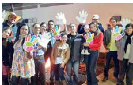
Santa Cruz das Palmeiras